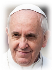
Discours du pape François visite d'un bidonville à Asuncion au Paraguay 12 juillet 2015